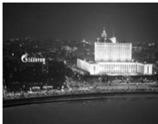
Gazprom fordert eine Vervierfachung des Gaspreises

Moskau – Russland hat Weissrussland damit gedroht, den Gashahn zuzudrehen, falls das Land die angekündigte Vervierfachung des Preises nicht akzeptiert. Der staatliche russische Gasmonopolist Gazprom erklärte nach Angaben russischer Nachrichtenagenturen am Montag, der derzeitige Liefervertrag laufe in sechs Tagen aus. (ht/sda)