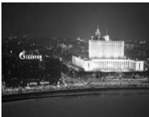
Gazprom fordert eine Vervierfachung des Gaspreises

Moskau – Russland hat Weissrussland damit gedroht, den Gashahn zuzudrehen, falls das Land die angekündigte Vervierfachung des Preises nicht akzeptiert. Der staatliche russische Gasmonopolist Gazprom erklärte nach Angaben russischer Nachrichtenagenturen am Montag, der derzeitige Liefervertrag laufe in sechs Tagen aus. (ht/sda)